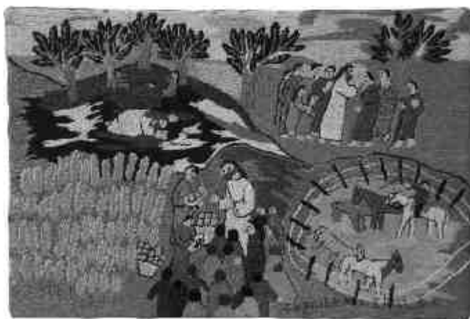
Bildtitel: Wie viele Brote habt ihr?, Las Bordadoras de Copiulemu